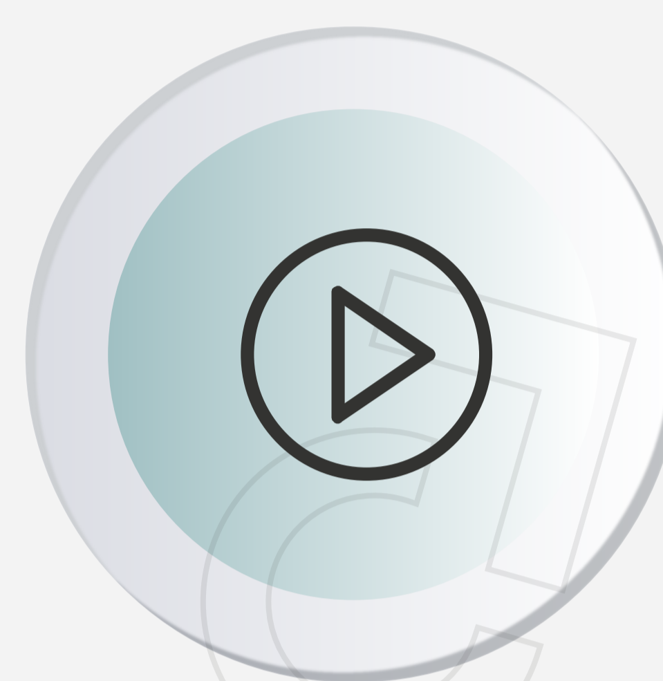
Plataformas de streaming