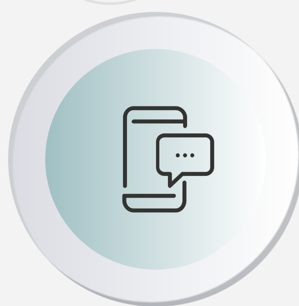
Assistentes virtuais e chatbots